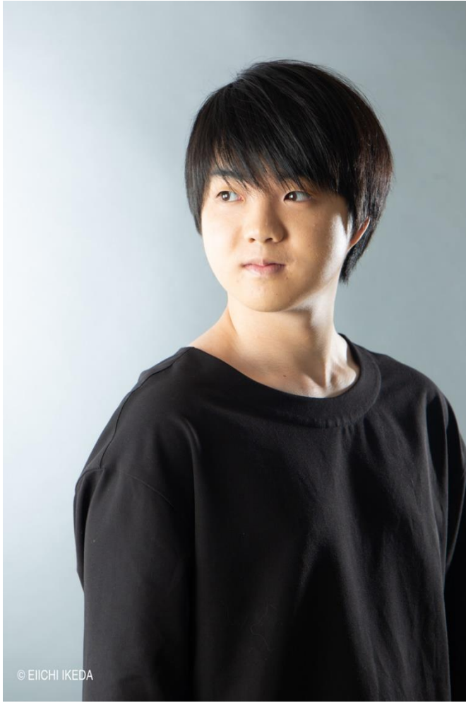
藤田真央 Mao Fujita アーティスト写真