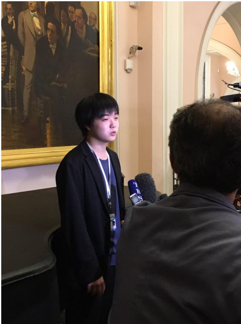
チャイコフスキー国際コンクールで報道陣からのインタビューに応える藤田真央